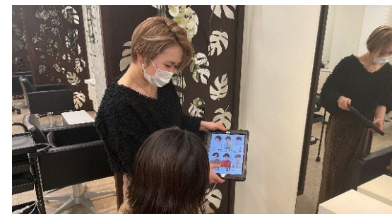
タブレットを使い、鏡前でヘアスタイルを提案